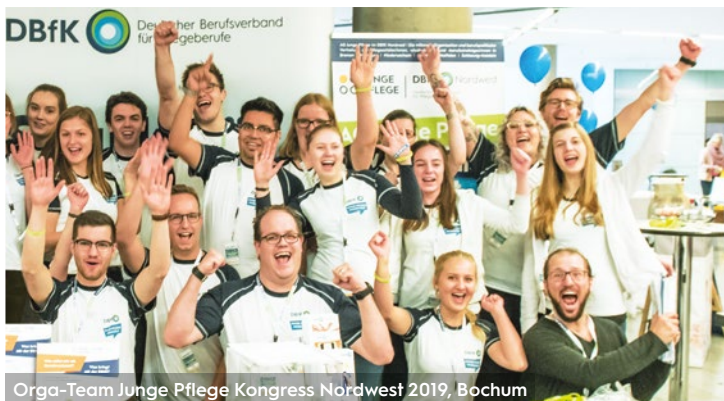
Orga-Team Junge Pflege Kongress Nordwest 2019, Bochum